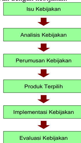
Gambar 1. Tahap-tahap Analisis Kebijakan

Carl W. Patton dan David S. Savicky (1993) dengan gamblang menjelaskan bahwa analisis kebijakan adalah tindakan yang diperlukan untuk merumuskan sebuah kebijakan, baik kebijakan yang baru sama sekali, atau kebijakan yang baru sebagai konsekuensi dari kebijakan yang sudah ada. Analisis kebijakan merupakan kegiatan pokok dalam perumusan kebijakan karena merupakan upaya untuk memberikan pijakan awal kenapa sebuah kebijakan harus dibuat. Dunn (1992) mendefinisikan analisis kebijakan sebagai disiplin ilmu sosial terapan yang menerapkan berbagai metode penelitian, dalam konteks argumentasi dan debat publik, untuk membuat penaksiran secara kritis, dan mengkomunikasikan pengetahuan yang relevan dengan kebijakan.